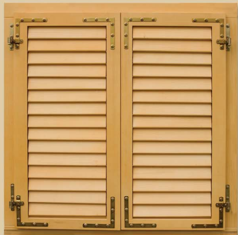
Fensterläden mit beweglichen oder mit fixierten Querleisten